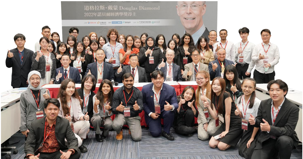
圖：禮聘多位國際級大師蒞校講學，師生可親自向大師請益!每年定期邀請諾貝爾得獎者舉辦大師論壇。